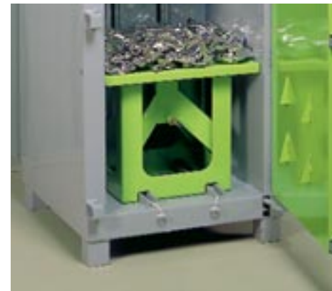
Βάση συμπίεσης κουτιών αλουμινίου (προαιρετικός εξοπλισμός)